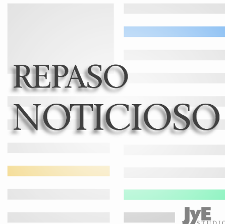
Foto y biografía para página RepasoNoticioso.com

Opcional pero altamente recomendado para los participantes activos: